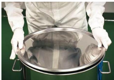
鋼製バンド(従来品)